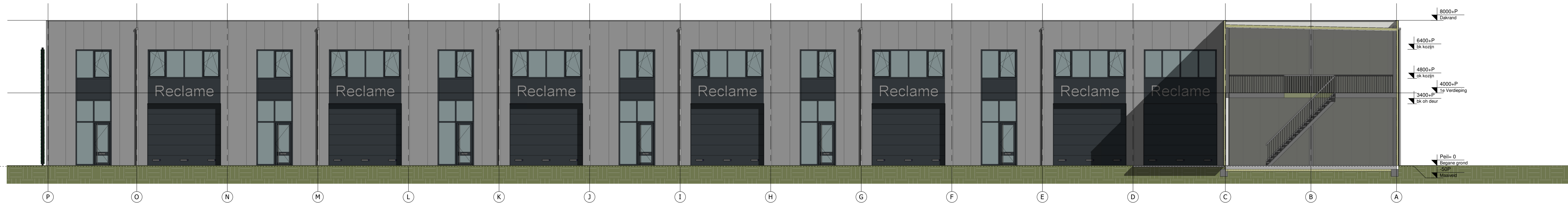
Vooraanzicht units 13 t/m 18