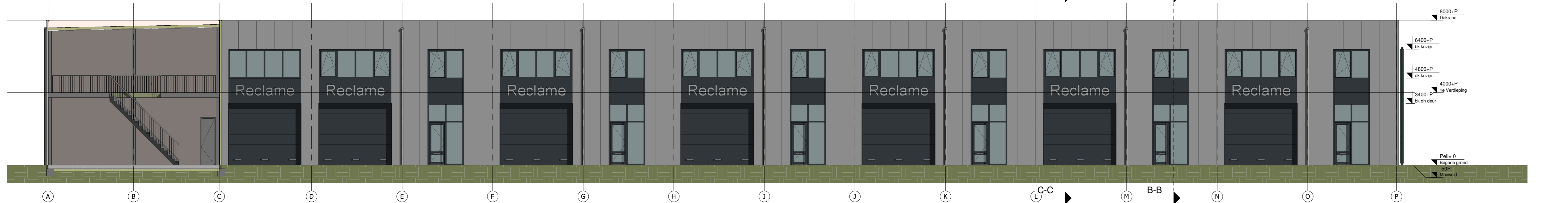
Vooraanzicht units 7 t/m 12